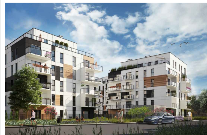
C1.01 BUDYNEK C2

Karta lokalu i wizualizacje mają charakter poglądowy. Mogą wystąpić różnice wymiarów pomieszczeń, lokalizacji przyborów sanitarnych, rozmieszczenia punktów instalacyjnych i usytuowania elementów powstałe w trakcie realizacji prac budowlanych lub wynikające z doprecyzowania dokumentacji na etapie projektu technicznego. Aranżacja wnętrza służy wyłącznie celom ilustracyjnym. Meble i urządzenia pozostają w gestii nabywcy. Karta lokalu stanowi zaproszenie do zawarcia umowy.